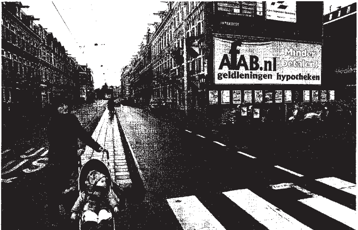
Reclamebillboard voor de in moeilijkheden verkerende financiële dienstverlener Afab aan een gevel in Amsterdam.